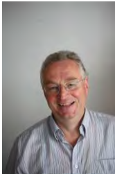
Pfr. Dr. Rainer Oechslen Beauftragter der Evang.-Luth. Kirche in Bayern für interreligiösen Dialog und Islamfragen